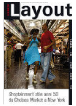
Shoptainment stile anni 50 da Chelsea Market a New York