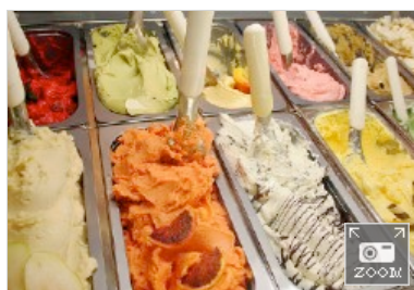
You Can Group al Sigep di Rimini

Dopo il successo di Street Sushi by Sosushi, rivisitazione brevettata della mitica Ape Piaggio per un nuovo e futuristico progetto di ristorazione mobile creato da Street Food Mobile™ , You Can Group presenta in anteprima al Sigep di Rimini, dal 23 al 27 gennaio, Gelape . Il nuovo progetto sarà una gelateria «in movimento» già pronta per la sua prima avventura: offrire il gelato alla crema della Gelateria Riccardo di La Spezia e i dolci al tè verde della linea Sosweet di Sosushi, il brand di cucina giapponese più grande in Italia.