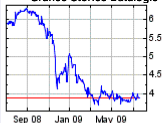
Grafico Storico Datalogic