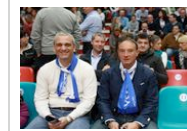
La Centrale sfiora l'impresa