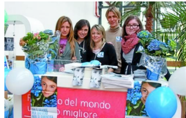
Le volontarie di Telefono Azzurro al centro Freccia Rossa