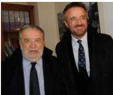
Pupi Avati e Christian De Sica