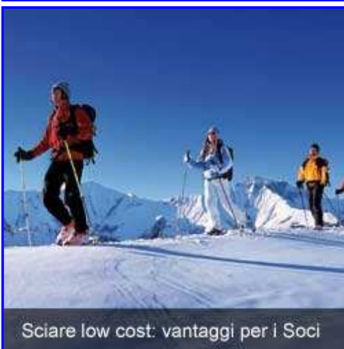
Sciare low cost: vantaggi per i Soci