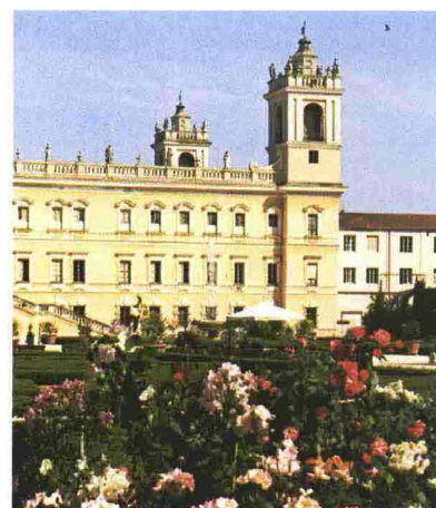
Sopra, il Parco della Reggia di Colorno (Parma). In basso, da sinistra in senso orario, il tempio del sole ai Giardini La Mortella, a Ischia; uno stallone quarter horse; un'ortensia recisa in vaso.

VERTEMATE (CO) . 5 aprile/9 maggio, Fiori&Colori è un'occasione per ammirare le fioriture del Parco botanico della