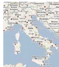
mappa degli eventi in corso>>